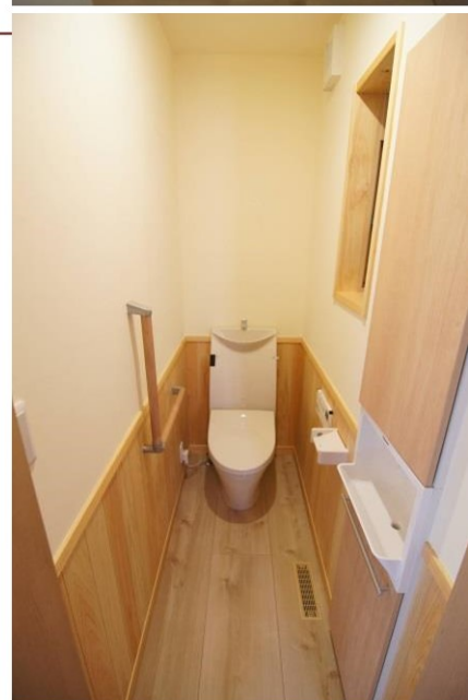
清掃性と温熱環境に配慮したトイレ。 寝室も近く安心です。