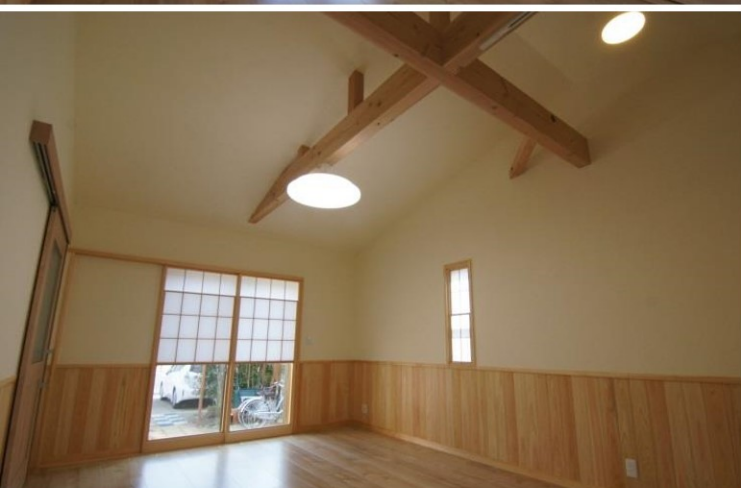
居間兼寝室は勾配天井仕上げで開放感をプラス。 機能性だけでなく、住み心地にもこだわりました。

壁と天井は珪藻土仕上げ、 腰壁はヒノキ材を使用しました。 床材は、あえて無垢板にはせず、 Panasonicアーキスペックフローアヒノキ柄を採用。 将来介護が必要になっても傷・汚れ・水に強く安心です。 また、オンレイの床下エアコンシステムを導入し、 増築部の居室・廊下・トイレは同一の室温に。 ヒートショック対策も万全です。