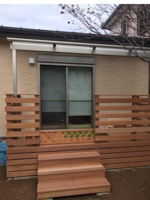
居間兼寝室の前面にウッドデッキを設置。 直接屋外に出ることができ、介護が必要になった際も便利。