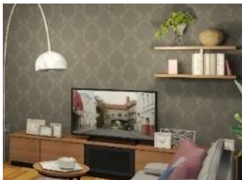
TVボード + 収納

和室とDKの間の壁をなくし、L型ソファも置ける広々した空間に。広さだけでなく部屋の奥まで光が届き、明るさも手に入れました。 (天井に梁を追加し構造も確認済)