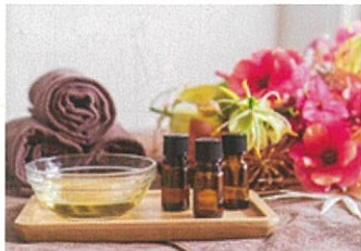
疲れた体を癒しませんか？