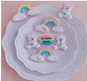
アイシングクッキー