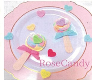
フェイクスイーツ